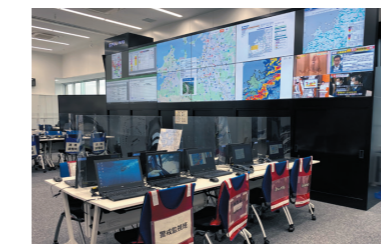
新災害対策本部室の整備(本市15階)