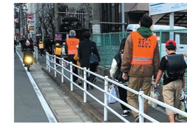
通学路の安全対策・整備推進