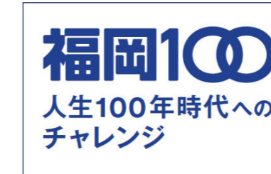
福岡100の取組みの推進