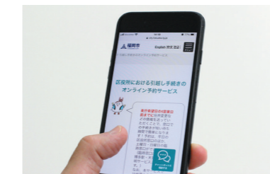
行政手続きオンライン化の推進