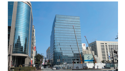
天神ビッグバンの推進(第1号完成)