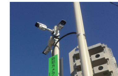
防犯カメラの更なる設置推進