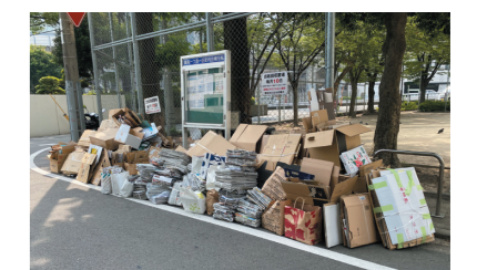
ごみ減量対策の推進