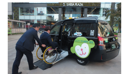
ユニバーサルデザインに基づくUDタクシー