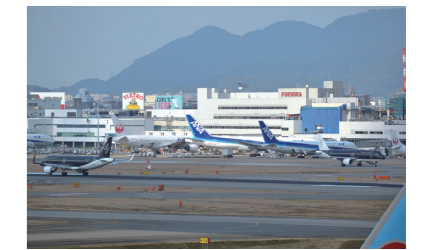
福岡空港の周辺整備と機能強化の推進