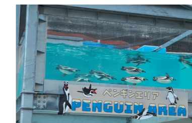
動物園にペンギンエリアオープン