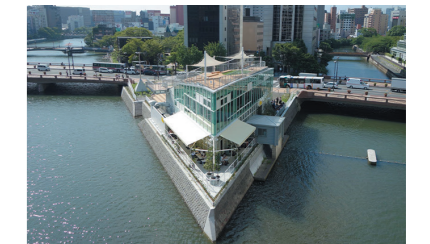
公園等、民間活力の導入推進