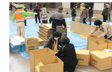
自主防災組織の体制強化と活動促進