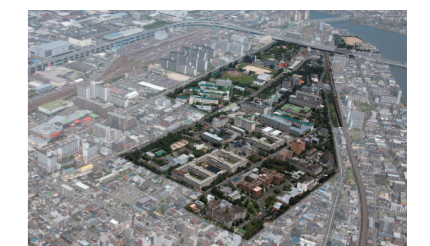
九大箱崎キャンパス跡地利用の検討